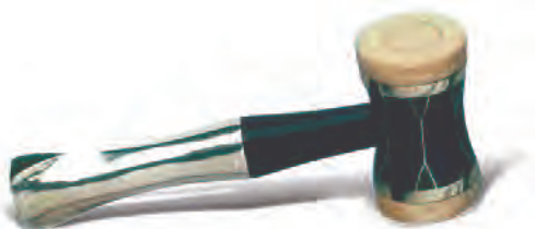
Marteau de commissaire-priseur créé par GOUDJI.

En provenance de grandes demeures et châteaux privés